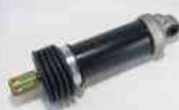
21654 Cilindro actuador de alta y baja con horquilla, para diferencial MB1620 4214120000