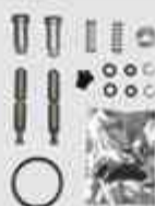
21508 Kit de reparación Válvula piloto sensores macho - MB / VW SP705