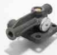
22584 Valv piloto tipo ZF - valv 3/2 x M12x2 Caja 4K120-GP - MB/VECO/RENAULT 0501205200 SV3302 185043 0012602757