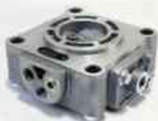
22033 Válvula piloto - 5/2 caja de cambios ZF16 VW VOLVO 4630630030 4630630050