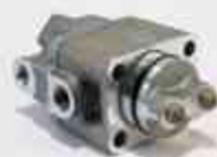
21507 Válvula piloto sensores macho Caja ZF16 - MB / VW 187538 SV3368 SV3367