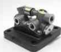
22032 Válvula piloto - 3/2 x 2 Caja ZF4S-120 - modelo antiguo MB1526 179678 - SV3360