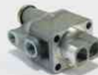
21163 Válvula piloto sensores hembra Caja ZF16 - MB / VOLVO VW Constellation 19.320 6038202043 2T2301367