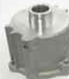
22049 Cilindro inferior (interior) de alta y baja Caja ZF16S - MB / VOLVO NH - FH - FM 1656239