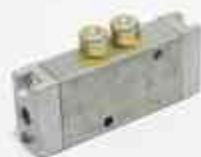
22655 Válvula neumática Caja 4K120-GP - MB / IVECO RENAULT 5710031040 5710031010 0501303270