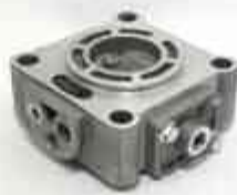
22034 Válvula piloto - 5/2 caja de cambios ZF16 MB 4630630020 4630630040