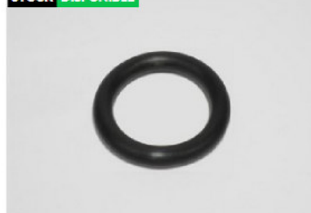
O-Ring 30.6x6.5 Perno Elastico Tras Sc