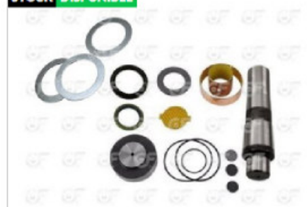
Jgo. perno punta de eje Scania S4 c/coinete

Código 24194 | 1405343 | 5 | 1405343 1912140 20284 7781