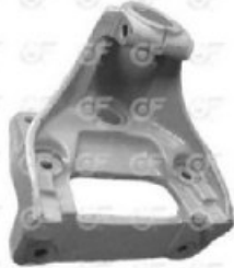
Soporte elastico trasero M/N P94/124