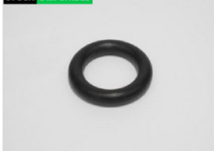
O-Ring 23x6.5 Perno Elastico Del Scania