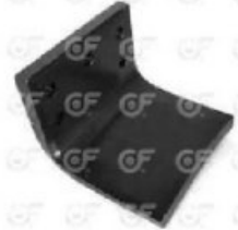
Tope elastico Scania 112/113

Código 24206 | 293723 | 5 | 293273 1377776