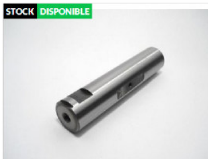
Pasador De Elastico 8 liso 30 x 137 - Nacional sin tratamiento