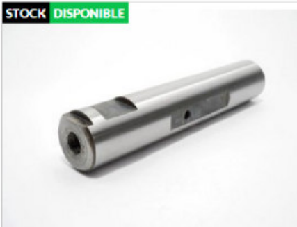
Pasador De Elastico 7 liso 25 x 125 - Nacional sin tratamiento