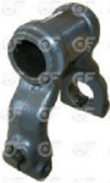
Gemelo de susp delantera Scania 112/113 - NAC