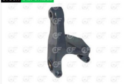
Soporte elastico delante tras der Sca P94/124