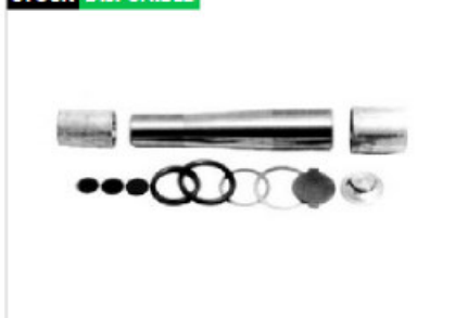
juego . Perno Punta Eje Scania S3 112/113

Código 23203 | 550714 | 5 | 550714 20060 7793