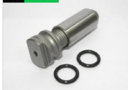
Pasador y buje roscado colectivo Ø56 (180)

Código 10587 | 587 | 5 | Ø32 x 168 x Ø56 en cabeza - Scania Bus S4