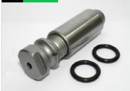
Pasador y buje roscado trasero (800)

Código 10460 | 0135036 0355147 | 5 | 0135036 0355147 135035+135036