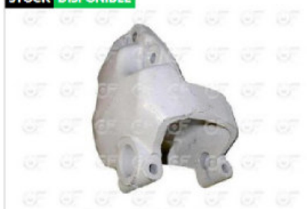
Soporte elastico delantero Scania 112/113