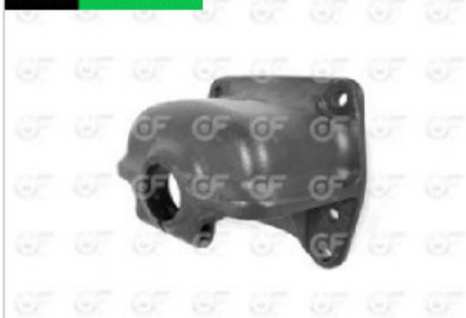
Soporte elastico trasera Scania 112/113