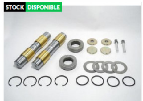
Juego Pernos Punta Eje Compl c/crap. 2 lados

Código 22052 | 3603300619 | 4 | 3603300619