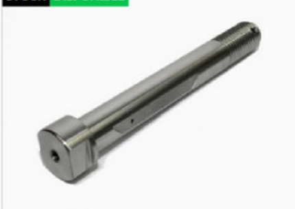
Perno tensor Trasero Eje Loco (150)

Código 10159 | 5 | Perno tensor Trasero eje Loco Ø30 x 249mm