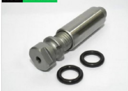
Pasador y buje roscado delantero (800)

Código 10461 | 0128680 0355145 | 5 | 0128680 0355145 128680 + 128681