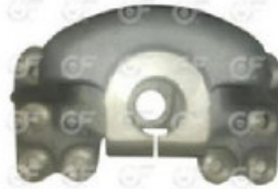
Soporte elastico trasero Scania S5

Código 24205 | 5 | Soporte trasero Scania serie 5