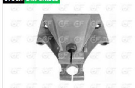
Soporte elastico delantero delant Sca P94/124