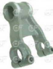
Gemelo de susp. trasera Scania 112/113 - NAC