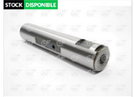
Pasador de elastico Liso trava al revés Ø 25 x 128

Código 10104 | 104 | Ø25 x 128 LISO C/ TRAVA INVERT MB NAC