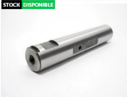
Pasador De Elastico 7 Liso Ø 25 X 128 ch

Código 22055 | 4 | Ø25 x 128 - con trat. DEL - ch