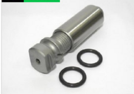
Pasador y buje roscado trasero largo (240)

Código 10686 | 355145+1364140 | 5 | 355145+1364140