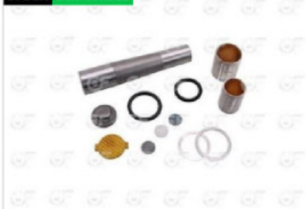
Jgo. perno punta eje Scania 111