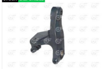
Soporte elastico delantera tra iz Sca P94/124