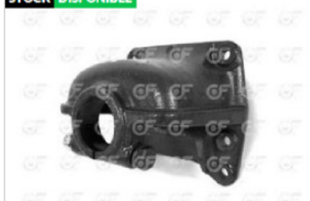
Soporte elastico trasera Sca P94/124