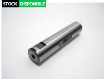
Pasador De Elastico 8 Tra Liso Ø 30 X 137

Código 22056 | 4 | Ø30 x 137 - con trat. TRAS - ch