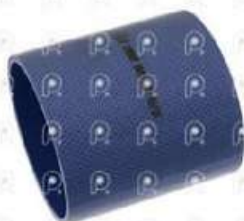
Manguera intercooler Scania 113