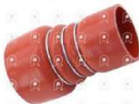
Manguera intercooler Ford 4000

Código 25458 | 7C356C640AA | 3 | XC356C640AA 1C356C640AA 07C356C640AA 9716