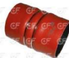
Manguera intercooler Scania 112/113

Código 24392 | 488368 | 5 | 488368 4589 525050 390581 1522011