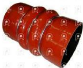
Manguera intercooler Ford 14000 Cummins

Código 25457 | 2C356C640BA | 3 | 2C356C640BA 9736 6619