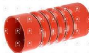
Manguera intercooler MB 1938 1941 OM 447

Código 25475 | 3885287682 | 4 | 3885287682 3885287482 3885287882 4583