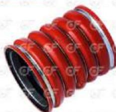
Manguera intercooler Scania S4

Código 24506 | 1358202 1522011 | 5 | 1358202 1522011 1442579 1794725 4591