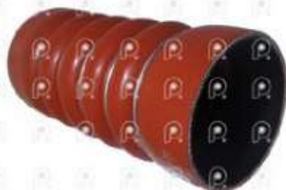
Manguera intercooler MB 1938S OM457 frontal

Código 25468 | 0005016182 | 4 | 0005016182 0015018082 4585