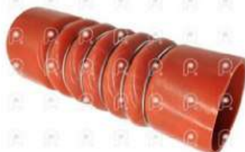
Manguera Intercooler MB OF 1417 1721 1722

Código 25473 | 3845011482 | 4 | 3845011482 4838