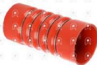
Manguera intercooler MB OM447 449 O400

Código 25471 | 3505288282 | 4 | 3505288282 3865288182 3487 3483