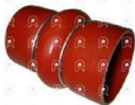
Manguera intercooler Ford VW 915 13180E

Código 25448 | 2TA117231A | 283 | 2TA117231A 2C456A640AA 4C456C640CA 9701 3494 4000