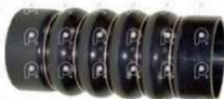
Manguera Intercooler MB 712 1620 1634

Código 25467 | 6965007175 | 4 | 6965007175 6965000275 6965007475 4581