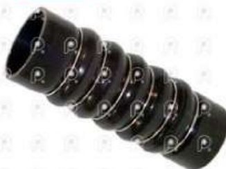
Manguera Intercooler MB 710 LO814

Código 25460 | 6705280682 | 4 | 6705280682 3490