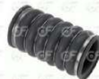
Manguera intercooler Scania S4

Código 24507 | 1525145 2057832 | 5 | 1525145 2057832 4592