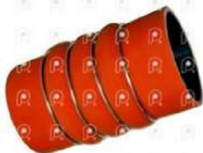
Manguera intercooler MB OH1621

Código 25459 | 0020947582 | 4 | 0020947582 6332