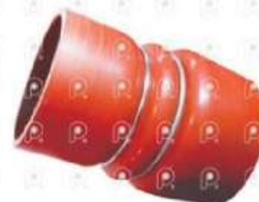
Manguera intercooler Ford C1317 1517

Código 25449 | 4C456C640DA | 3 | 4C456C640DA 9735 8598