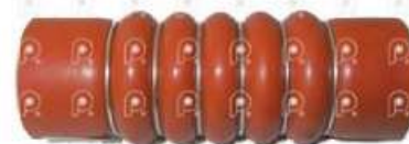
Manguera Intercooler MB 710 LO814

Código 25466 | 6705280582 | 4 | 6705280582 6885288382 3489