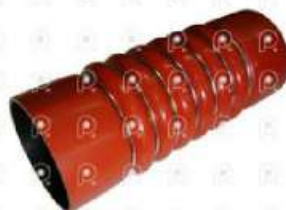
Manguera intercooler MB 1633

Código 25476 | 3865287382 | 4 | 3865288282 3865288782 3865287382 3945017382 3482 3481