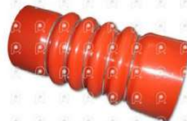
Manguera intercooler MB 712 1620 1634

Código 25470 | 6965007375 | 4 | 6965007375 6965000375 6965007575 4580