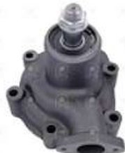
Bomba de agua Scania 111

Código 2006510 | 259065 | 5 | 259065 1313 549 26510