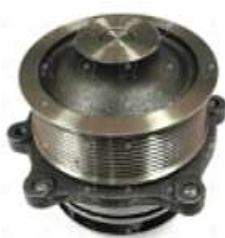
Bomba de agua Iveco Cursor Cavallino

Código 2006534 | 99483937 | 1 | 99483937 1838 26534