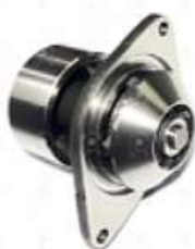
Bomba de agua Ford VW 6BT

Código 2006523 | 283 | TRA121005 BF9X8501A 1322 BA257 10029 26523