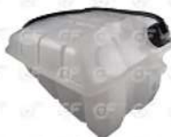
Deposito de expansion Iveco Cavallino Attack

Código 2003711 | 98426670 | 1 | 98426670 6883 000830 8976 23711