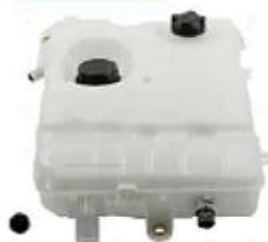
Deposito de expansion Renault Premium Midlum

Código 2005695 | 5010514340 | 24 | 5010514340 7420783 159 50101414665 7421017015 7420983308 5010141465 25695