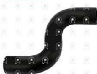
Manguera refrigeracion Scania PGR

Código 2007047 | 1514110 | 5 | 1514110 2102 27047