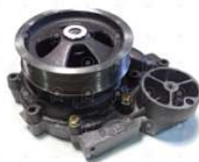
Bomba de agua Scania S4 C/tapa rotor bajo

Código 2006517 | 1508533 | 1508533 1353072 1883 26517