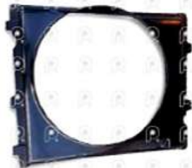
Deflector ventilador MB 1933 Axor

Código 2008007 | 9405050655 | 9405050655 001281 28007