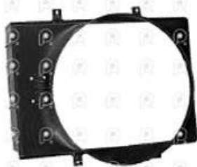
Deflector de ventilador Atego 1725

Código 2008013 | 9585050455 | 4 | 9585050455 000713 28013