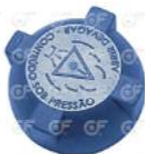
Tapa deposito expansion S/Valvula Ford VW MB

Código 2003729 | 4283 | F87Z8101AA F87A8101AA T75121484 10344 2273 23729