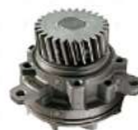
Bomba de agua Volvo FH FM

Código 2006521 | 8170305 | 21 | 8170305 20431135 20713787 1581 26521