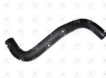
Manguera superior de radiador Ford 915

Código 2007297 | 96HU8260AA | 3 | 96HU8260AA 2UH121115 5929 27297