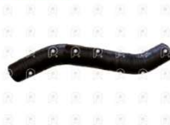
Manguera intercooler a la admision Ford 1722E

Código 2007275 | 6C456K863AB | 3 | 6C456K863AB 11202 938 27275