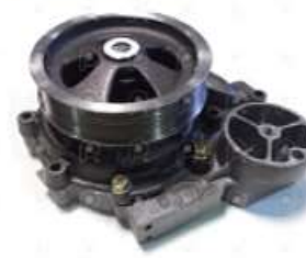
Bomba de agua Scania S4 S5 C/tapa rotor alto

Código 2006518 | 1787120 | 5 | 1787120 1365841 1546188 1884 10268 26518