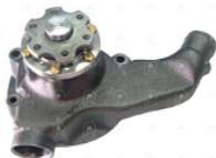
Bomba de agua MB 1620

Código 2006503 | 3662000401 | 4 | 3662000401 3662000701 3762000701 1280 BA150 10170 26503