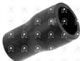
Manguera de refrigeracion Scania PGR

Código 2007054 | 1755954 | 5 | 1755954 2108 27054