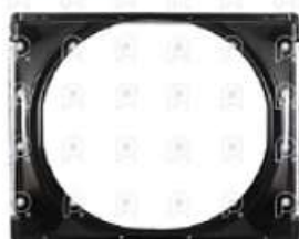
Deflector de ventilador VW 17310 18310

Código 2008002 | 2T0121207A | 28 | 2T0121207A 000455 28002