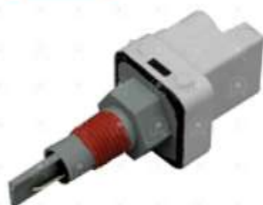
Sensor nivel de agua Ford nuevo 1719 1932

Código 2006050 | BC458B397AA | 3 | BC458B397AA 000834 26050