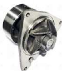
Bomba de agua Cummins electroni ISC Ford VW

Código 2006531 | 40890647 | 283 | 40890647 1605 26531