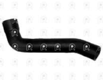
Manguera sup de radiador Ford 1722 L/nueva

Código 2007283 | AC458260CA | 3 | AC458260CA 11207 27283