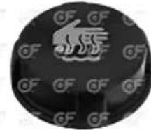
Tapa deposito expansion Volvo Reanult

Código 2004281 | 20783868 | 2124 | 20783868 74207836668 10317 24281