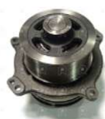
Bomba de agua Iveco Stralis

Código 2006533 | 500356553 | 1 | 500356553 1771 11762 26533