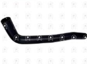
Manguera de agua Ford 1722 6CT

Código 2007296 | YC458286BA | 3 | YC458286BA 5850 4722 27296