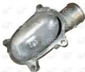
Tapa termostato Scania S5

Código 2004646 | 1793028 | 5 | 1793028 24646