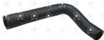
Manguera inf radidador MB 1938

Código 2007520 | 3885017982 | 4 | 3885017982 3885017282 2124 27520