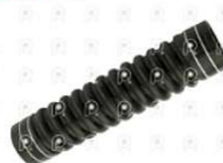
Manguera radiador agua corrugada Scania 113

Código 2007041 | 1375718 | 5 | 1375718 1315195 368559 290849 2612 11451 3288 27041