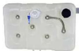
Deposito agua MB S/Sensor 1218 - 1418 - 1620

Código 2006112 | 3845008249 | 4 | 3845008249 5932 000012 5932 26112