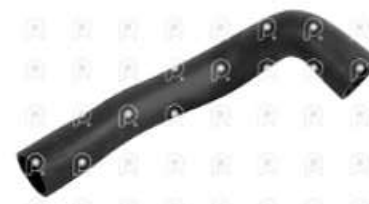
Manguera radiador de agua Scania PGR

Código 2007018 | 1446379 | 5 | 1446379 2010515 2661 27018