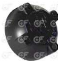
Tapa deposito expansion c/valvula Ford VW

Código 2003728 | F87Z8101AA | 14283 | F87Z8101AA 2273 23728