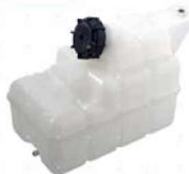
Deposito de expansion Iveco

Código 2005694 | 8166285 | 1 | 8166285 7363 25694