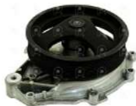
Bomba de agua Scania S5 DC09.13

Código 2006519 | 2224112 | 5 | 1942 2224112 2006397 26519