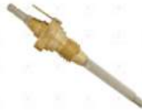
Sensor nivel deposito agua VW

Código 2006071 | T2D919370A | 28 | T2D919370A 000718 26071