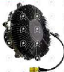
Embrague viscoso VW 17280

Código 2007699 | 2U2121302A | 28 | 2U2121302A 27699