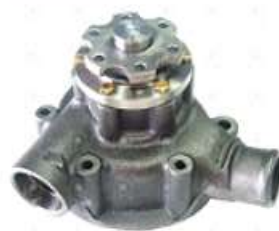
Bomba de agua MB 710 913 914

Código 2006504 | 3642000101 | 4 | 3642000101 3642000901 3642002001 1319 BA239 10171 26504