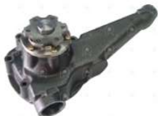
Bomba de agua cuello largo MB 1620

Código 2006500 | 3662000901 | 4 | 3662000901 3762000901 3662006801 1351 VMGBA376 BA1376 7102 26500