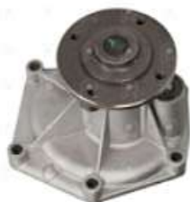
Bomba de agua Scania P93 210 250

Código 2006512 | 1377571 | 5 | 1377571 1331 11955 26512