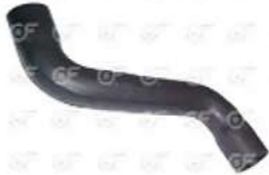
Manguera de Radiador Scania S4 - OR

Código 2004499 | 1377331 | 5 | 1377331 3260 24499