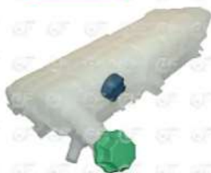
Deposito de expansion MB Axor 1933 2035 2040

Código 2003725 | 9405010003 | 4 | 9405010003 5421 23725