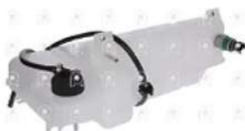
Deposito expansion Iveco Nueva Daily

Código 2006681 | 504136607 | 1 | 504136607 001000 26681