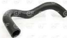
Manguera deposito de agua Scania S4 OR

Código 2004504 | 1391795 | 5 | 1391795 24504