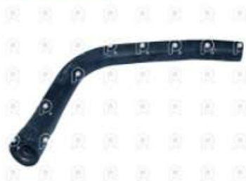
Manguera inferior de radiador Ford 1832

Código 2007272 | 6C458286AD | 3 | 6C458286AD 5911 27272