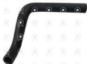
Manguera deposito de agua Iveco Tector

Código 2007072 | 5801365890 | 1 | 5801365890 1524 27072