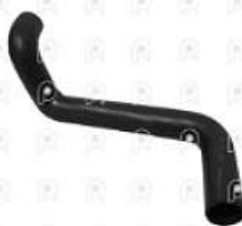
Manguera sup radiador Iveco Tector

Código 2008540 | 504062581 | 1 | 504062581 1537 503346429 28540