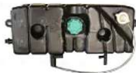
Deposito agua MB S/Sensor OH 1621 / 1721

Código 2003723 | 6935007049 | 4 | 6745000049 6935007049 000127 23723