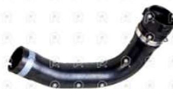
Manguera refrigeracion Scania PGR

Código 2007056 | 1422499 | 5 | 1422499 2582 27056