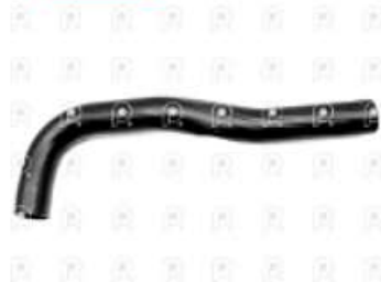
Manguera inferior de radiador VW 17300 17310

Código 2007300 | 2VU121073 | 28 | 2VU121073 3711 27300