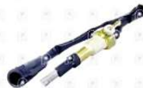
Sensor nivel de agua Ford Vw 1722 17300

Código 2006670 | TJG919370 | 283 | TJG919370 000715 XC458B397AA 26670