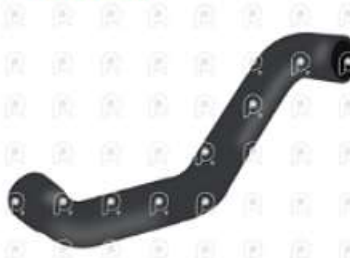
Manguera superior radiador Ford 1832

Código 2007274 | 6C458260AC | 6C458260AC 5939 27274