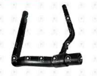
Manguera inferior de radiador Ford 1517E

Código 2007289 | AC458286BB | 3 | AC458286BB 11224 27289