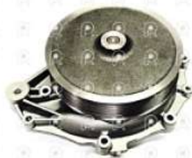
Bomba de agua Scania S5 PGR DC13

Código 2007523 | 1546188 | 5 | 1966 1546188 1787120 2224112 2006397 10268 27523