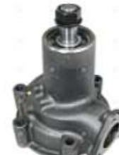
Bomba de agua Scania 112/113

Código 2006511 | 524866 | 5 | 524866 1314 10106 26511