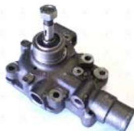
Bomba de agua Iveco Daily

Código 2006535 | 500361919 | 1 | 500361919 500300476 99438900 500361203 503644438 500361370 1579 26535