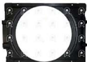
Deflector de aire Ford línea nueva 1722

Código 2007954 | AC458146CA | 3 | AC458146CA DC458146AA 000724 27954