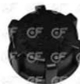
Tapa deposito de expansion ScaniaS4 C/Valvula

Código 2004278 | 1374050 | 5 | 1374050 1849428 1757490 24278