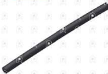
Manguera de agua MB 1620

Código 2007260 | 900271032031 | 900271032031 2353 27260