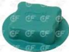
Tapa deposito de expansion Volvo

Código 2004279 | 1676576 | 21 | 1676576relació | n 1676400relació | n 24279