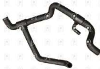
Manguera inferior de radiador MB 1620

Código 2007257 | 6955010582 | 4 | 6955010582 2467 525 27257