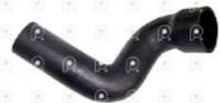
Manguera de refrigeración MB 1620

Código 2007261 | 3845017282 | 4 | 3845017282 2323 27261