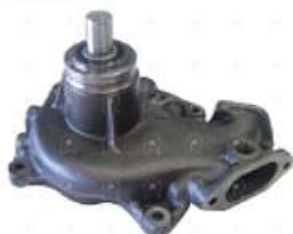
Bomba de agua Fiat 619 190 33 eje sin rosca

Código 2006537 | 4679303 | 1 | 4679303 4679304 1807 26537