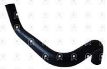
Manguera de calefaccion Scania S4

Código 2007016 | 1385836 | 5 | 1385836 2567 27016