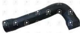
Manguera agua radiador MB Axor

Código 2007245 | 9405000175 | 4 | 9405000175 2495 696 27245