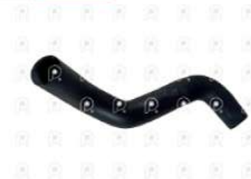
Manguera intercooler a la admision Ford 1517E

Código 2007290 | 6C45K863CA | 3 | 6C45K863CA 11225 27290