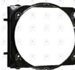
Deflector de ventilador Iveco Tector 170E22

Código 2008015 | 504040130 | 1 | 504040130 000915 504122561 28015