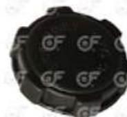
Tapa deposito expansion Scania 112 113

Código 2003717 | 1616744 | 5 | 1616744 23717