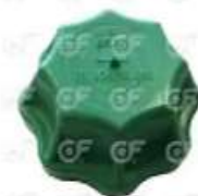
Tapa deposito de agua Iveco Mercedes

Código 2004275 | 93163623 | 14 | 93163623 0005016415 000393 2674 24275