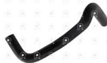
Manguera de calefaccion Scania S4

Código 2007015 | 1425599 | 5 | 1425599 2566 1532223 27015