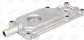
Tapa sistema refrigeracion Scania S4

Código 2004643 | 1864077 | 5 | 1864077 122787 14.3000.39 8699031057873 0104024VDN 24643