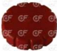
Tapa deposito de expansion MB Atego

Código 2004282 | 9705280110 | 4 | 9705280110 000394 9474 24282