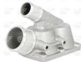
Base de termostato Scania S4

Código 2004645 | 1381494 | 5 | 1381494 3854 24645