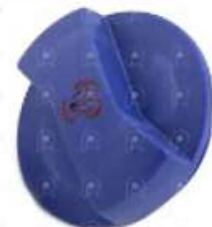
Tapa deposito agua VW Constellation

Código 2005787 | 1J0121321B | 28 | 1J0121321B 10315 000369 5557 25787