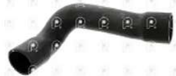
Manguera de agua Scania S4

Código 2004501 | 1377231 | 5 | 1377231 2647 8881 24501