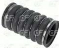
Manguera intercooler Scania S4

Código 2004507 | 1525145 2057832 | 5 | 1525145 2057832 4592 4592 24507