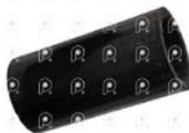
Manguera de refrigeracion Scania S4

Código 2007017 | 1376295 | 5 | 1376295 2652 27017