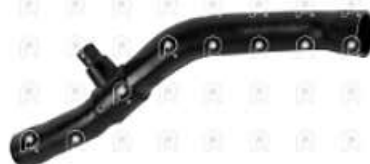
Manguera de radiador de agua Scania 113

Código 2007020 | 382983 | 5 | 382983 2611 8980 27020