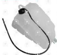
Deposito de expansion Iveco 170E28

Código 2006680 | 98426669 | 1 | 98426669 000995 26680