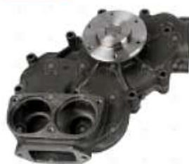
Bomba de agua MB OM 457 1634 Axor C/frezado

Código 2006538 | 4572010001 | 4572010001 1886 26538