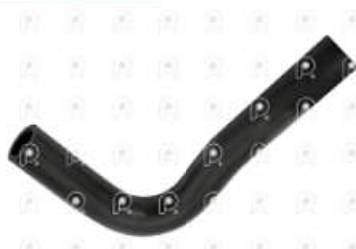
Manguera refrigeracion Scania PGR

Código 2007048 | 1755956 | 5 | 1755956 2103 27048