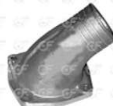
Tapa Porta Termostato Scania 112/113

Código 2003146 | 278333 | 5 | 278333 1377064 2433 23146