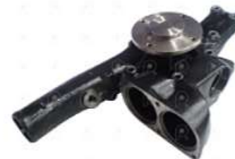
Bomba de agua MB Axor 1933 Atego 1725

Código 2006508 | 9062004201 | 4 | 9062004201 9062004801 1590 11791 26508