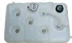
Deposito de agua C/sensor MB 1624 1634

Código 2003724 | 6965000049 | 4 | 6965000049 000016 5936 5936 23724