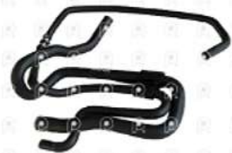
Manguera deposito de agua MB Atego

Código 2007235 | 9585010982 | 4 | 9585010982 2836 27235