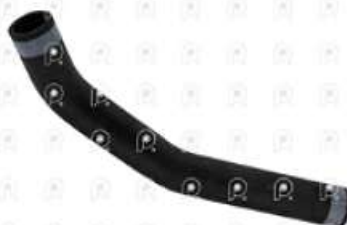
Manguera de refrigeracion Scania PGR

Código 2007055 | 1444948 | 5 | 1444948 2585 27055