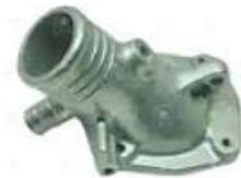
Tubo sistema de refrigeracion Scania 112/113

Código 2005933 | 372111 | 5 | 372111 8096 2430 25933