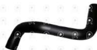
Manguera de tubo expansion Scania T113

Código 2007021 | 362777 | 362777 2615 27021