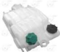
Deposito de expansion C/sensor Iveco Eurotec

Código 2003710 | 8168290 | 1 | 8168289 8168290 6872 8975 000445 23710