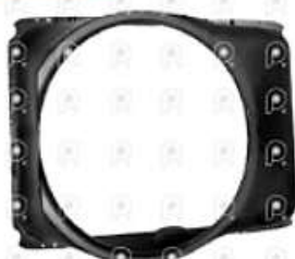
Deflector de ventilador VW 19320

Código 2008003 | 2T2121207AC | 28 | 2T2121207AC 000711 28003