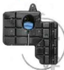
Deposito agua Const. 19320 C/Tapa y sensor

Código 2006066 | 2R2121405K | 28 | 2R2121405K 000107 2T2121405K 000437 26066