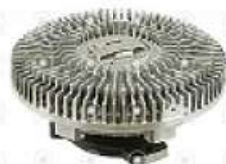
Embrague viscoso MB Actros

Código 2007694 | 0002008222 | 4 | 0002008222 27694