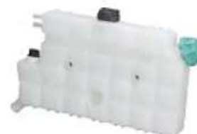
Deposito agua MB Accelo c/tapas

Código 2006120 | 9795000349 | 4 | 9795000349 000203 6456 6456 26120