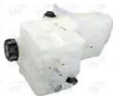
Deposito de expansion c/ sensor Scania S4

Código 2003714 | 1855164 | 5 | 1894478 1855164 1765735 1511775 10989 000759 23714