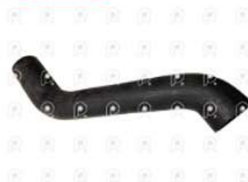
Manguera de intercool a la admision Ford 1932

Código 2007280 | BC456K863DB | 3 | BC456K863DB 11204 27280