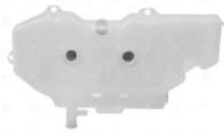
Deposito de expansion Ford Cargo 1722E 1832E

Código 2006226 | 9C458A084AA | 3 | 9C458A084AA 6473 000504 26226