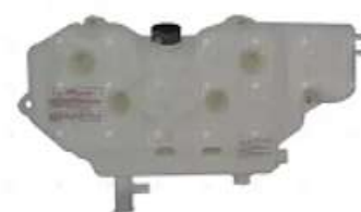
Deposito agua Ford elect. c/tapas

Código 2006060 | 6C458A084AD | 3 | 6C458A084AD 000904 6C458A084AB 6C458A084AC 4222 26060