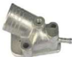
Tapa Sistema Agua Porta Bulbo Scania

Código 2003144 | 384037 | 5 | 384037 2428 23144