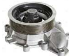
Bomba de agua Scania S4 S5 S/tapa

Código 2006515 | 5 | 1787120 1365841 1546188 1604 BA650 10268 26515