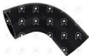
Manguera de refrigeracion Scania S4

Código 2006655 | 1376226 | 5 | 1376226 2643 26655