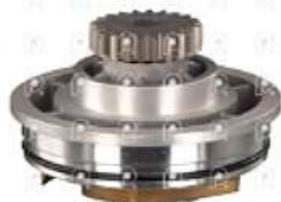
Bomba de agua Renault Premium TR

Código 2006646 | 500185427 | 24 | 500185427 5001858484 1825 26646