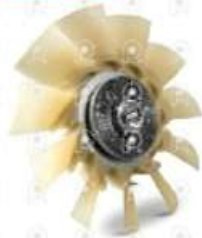
Paleta ventilador Volvo VM

Código 2007692 | 20765700 | 21 | 20765700 27692