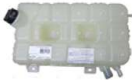
Deposito agua Ford M/N C1317 C1722 C/Tapas

Código 2006069 | BC458A084AA | 3 | BC458A084AA 000725 6488 6488 26069