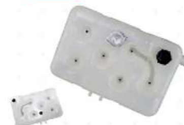
Deposito agua c/sensor MB 0500R

Código 2006136 | 3685000149 | 4 | 3685000149 6882 000828 26136