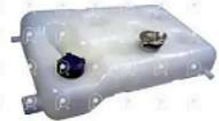
Deposito de agua MB 1938E

Código 2007231 | 6965007149 | 5 | 6965007149 000014 27231