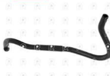
Manguera de refrigeracion Scania PGR

Código 2007053 | 1446221 | 5 | 1446221 2107 27053