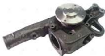
Bomba de agua MB 712 914 un termostato

Código 2006506 | 9042000201 | 9042000201 9042002201 9042000701 9042003801 1393 BA453 9042002501 10172 26506