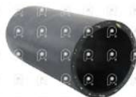
Manguera de refrigeracion Iveco Tector

Código 2007077 | 500362684 | 1 | 500362684 1577 27077