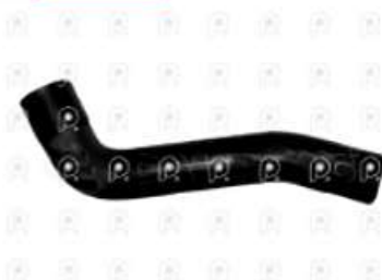
Manguera superior radiador Ford 1517E

Código 2007277 | AC458260BA | 3 | AC458260BA 11203 27277