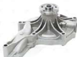
Bomba de agua Volvo Renault

Código 2006520 | 20744939 | 2124 | 20744939 21468471 7420744940 7485000763 1820 26520