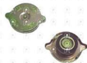
Tapa de radiador 7 libras MB 608 1114 1518

Código 2005254 | 3445010315 | 4 | 3445010315 0005010215 0455010015 50211 2227 25254