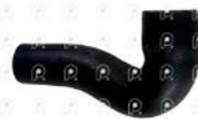
Manguera radiador Iveco Cavallino Cursor

Código 2007225 | 5801353721 | 1 | 5801353721 1644 27225