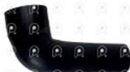
Manguera agua de radiador a termostato Iveco

Código 2007224 | 503346819 | 1 | 503346819 1590 27224