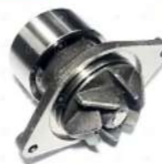
Bomba de agua Ford Iveco VW ISB

Código 2006528 | BG5X8501AA | 1283 | 1607 BG5X8501AA 504062854 4891252 BA630 2R0121004 250121004B 10167 26528