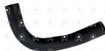
Manguera refrigeracion Iveco Tector

Código 2007075 | 5801574789 | 1 | 5801574789 1574 27075