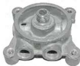
Base filtro de agua Scania 112 113

Código 2005936 | 350483 | 5 | 350483 25936