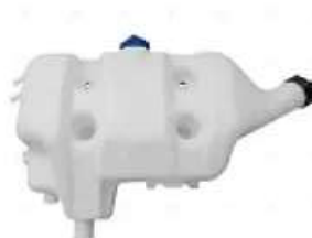
Deposito de agua VW 9150 9150e C/Tapa

Código 2006045 | 2P0121405 | 28 | 2P0121405 3599 000178 3599 9103 26045