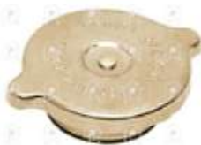
Tapa de radiador Scania 111

Código 2005500 | 60163 | 5 | 60163 25500