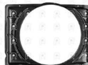
Deflector de aire Ford 1722E

Código 2007955 | 6C458146CB | 3 | 6C458146CB 6C458146CC 000429 27955