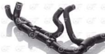
Manguera deposito de agua Scania S4 OR

Código 2004493 | 1790071 2038638 | 5 | 1790071 2038638 24493