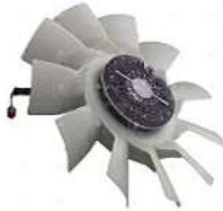
Ventilador Completo c/paleta Scania PGR

Código 2005740 | 2035612 | 5 | 1776552 2035612 25740