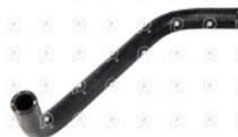
Tubo deposito agua Iveco Cursor

Código 2007071 | 503346941 | 1 | 503346941 1518 27071