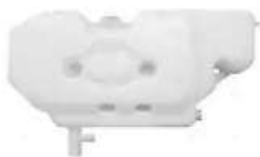
Deposito agua Ford cargo 1722 1730 S/Tapas

Código 2003726 | 6C458A084BC/BB | 3 | 6C458A084BC 6C458A084BB 000464 3182 23726