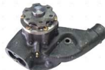
Bomba de agua MB 1114 1518

Código 2006502 | 3522009401 | 4 | 3522009401 3522003801 3532000301 3532002801 BA026 1169 10169 26502