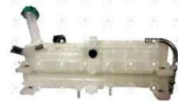
Deposito de expansion Mb 1938 frontal

Código 2006671 | 9585000149 | 4 | 9585000149 000205 26671