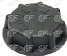
Tapa deposito expansion Volvo

Código 2004280 | 3979593 | 3979593 1849428 1676319 2728 24280