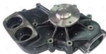
Bomba de agua MB OM 457 1634

Código 2006501 | 4032004901 4752000201 4752000101 1535 BA428 7888 26501