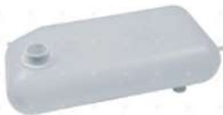
Deposito agua Scania T 112/113

Código 2006078 | 1320601 | 5 | 1320601 290851 4740 000005 4740 26078