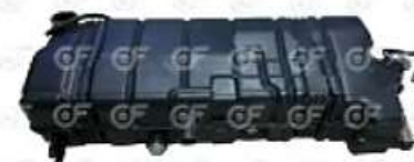
Deposito de expansion MB Bus O400/500

Código 2003721 | 6295000849 | 4 | 6295000049 6295000849 23721