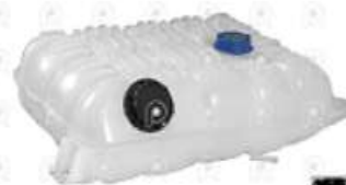
Deposito de expansion Volvo FH

Código 2007673 | 22821826 | 21 | 22821826 22430043 000950 27673