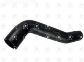
Manguera radiador de agua Ford 1517E

Código 2007281 | AC458260BD | 3 | AC458260BD 11205 27281