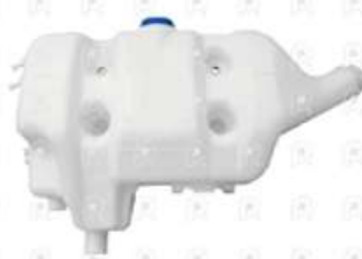
Deposito de agua VW 9160E Advantch

Código 2008138 | 2P0121405C | 28 | 2P0121405C 000891 28138