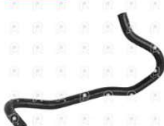
Manguera de agua Scania PGR

Código 2007051 | 1755948 | 5 | 1755948 1733731 2105 27051