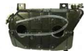
Deposito agua MB 1938 - 1633 - 1620

Código 2006111 | 3845007149 | 4 | 3845007149 000011 5931 5931 26111