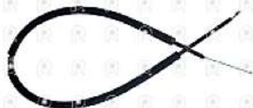
Cable calefactor Ford cargo

Código 2008901 | E6HZ18518A | 3 | E6HZ18518A 4001 28901