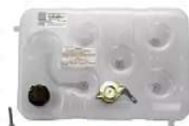
Deposito agua c/sensor MB ATRON 1624 1634

Código 2006135 | 6955000049 | 4 | 6955000049 000762 6879 6879 26135