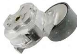
Tensor de correa MB 1938 electronico

Código 2005779 | 9062001770 | 9062002070 9062001470 9062000270 9062000170 906201770 9062001770 415 25779