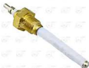
Bulbo Sensor nivel de agua Scania S3-OR

Código 2004443 | 1304725 | 5 | 1304725 575 24443