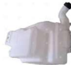
Deposito agua Scania S5 C/Tapa

Código 2006081 | 1850266 | 5 | 1850266 1769441 000515 6875 26081