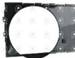
Deflector de ventilador Axor 2035 2040

Código 2008012 | 9585050255 | 4 | 9585050255 000421 28012