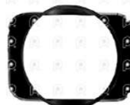
Deflector de ventilador VW 17280

Código 2008004 | 2Z0121207AB | 28 | 2Z0121207AB 001049 28004