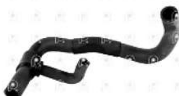
Manguera deposito de agua Scania S4 - OR

Código 2004492 | 1545116 1531776 | 5 | 1545116 1531776 2664 8882 24492