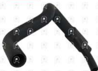
Manguera de agua Iveco Cavallino 450e32

Código 2007132 | 503347614 | 1 | 503347614 1557 27132