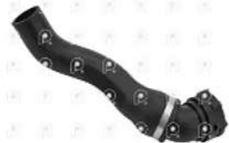
Manguera de refrigeracion Axor

Código 2007246 | 9405000075 | 4 | 9405000075 2493 748 27246