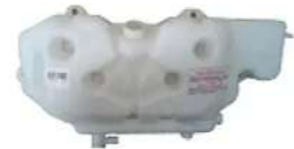
Deposito agua Ford Cargo 915e - 1517e - 1317e

Código 2006077 | 9C458A084BA | 3 | 9C458A084BA CC458A084AA 6474 000505 6474 26077