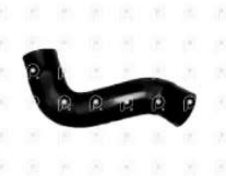
Manguera superior de radiador Ford 815E

Código 2007286 | AC458260AA | 3 | AC458260AA 11210 27286