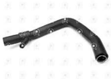
Manguera inferior de radiador Ford 1722E

Código 2007282 | 4C458286CF | 3 | 4C458286CF 11206 27282