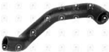
Manguera de agua MB Atego

Código 2007244 | 9735010082 | 4 | 9735010082 2832 27244