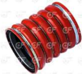
Manguera intercooler Scania S4

Código 2004506 | 1358202 1522011 | 5 | 1358202 1522011 1442579 1794725 4591 4591 24506