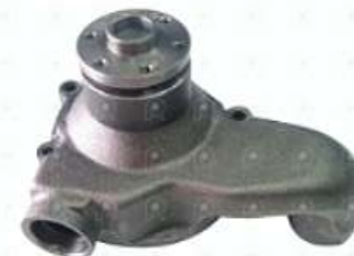
Bomba de agua cuello curvo MB 1620 1720

Código 2006505 | 3762000001 | 4 | 3762000001 3762000501 3762000601 1361 10107 26505