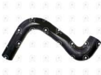
Manguera superior de radiador Ford 1517

Código 2007293 | XC458260BA | 3 | XC458260BA 3677 25R121115 27293