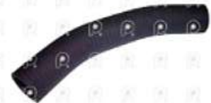
Manguera de radiador de agua MB 1620

Código 2007258 | 6955017282 | 4 | 6955017282 2367 541 27258