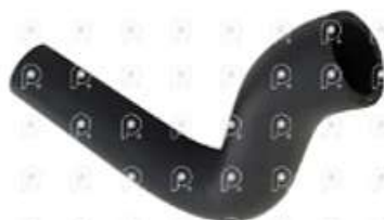
Manguera de refrigeracion Iveco Cursor

Código 2007079 | 503346993 | 1 | 503346993 1508 27079