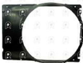
Deflector de ventilador MB 1634

Código 2008011 | 6955050055 | 4 | 6955050055 000293 28011