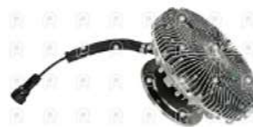
Embrague viscoso MB Axor Euro 5

Código 2008408 | 0002007722 | 4 | 0002007722 0012000622 28408