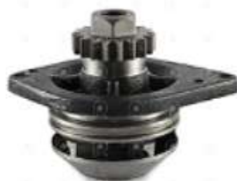
Bomba de agua Vw Iveco MWM 6.10

Código 2006526 | 2R0121004 | 1283 | 2R0121004 500054206 500052824 503355453 1360 940707310036 961087311026 26526