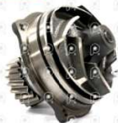
Bomba de agua Iveco Eurotech Eurotrakker

Código 2006700 | 99445447 | 99445447 500350785 11953 26700