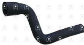
Manguera de refrigeración MB 1620

Código 2007259 | 3845017182 | 4 | 3845017182 2334 27259