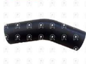
Manguera de agua MB 1620

Código 2007264 | 3845017982 | 4 | 3845017982 2388 27264