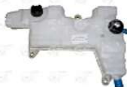
Deposito de expansion Volvo linea VM / Renault

Código 2003719 | 20783901 | 2124 | 20783901 7420783901 7420828448 5010263004 6487 23719