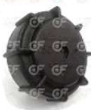
Tapa deposito expansion Cavilino Attack

Código 2004274 | 98405456 | 1 | 98405456 24274