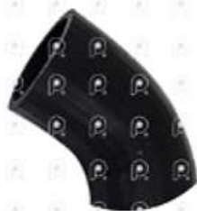
Manguera filtro de aire Iveco Tector

Código 2007076 | 503104960 | 1 | 503104960 1576 27076