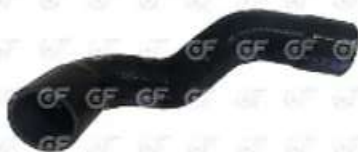
Manguera de radiador a Termostato S4 - OR

Código 2004495 | 1374040 | 5 | 1374040 24495