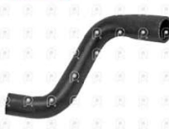
Manguera refrigeracion MB Sprinter OM651

Código 2007269 | 9065010682 | 4 | 9065010682 2879 27269