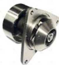
Bomba de agua Ford VW 6CT 3 agujeros

Código 2006524 | TF3121005 | 283 | BF9X8501AA TF3121005 BF8X8501A 1323 BA295 10166 26524