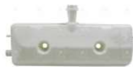
Deposito agua Scania R 112/113

Código 2006079 | 1320602 | 5 | 1320602 6453 000133 6453 26079