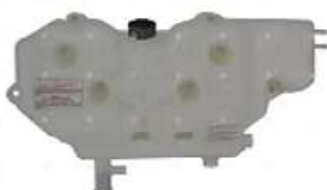
Deposito agua Ford mecanico c/tapas

Código 2006062 | 6C458A084BC | 3 | 6C458A084BC 000903 3182 26062