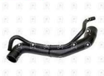
Manguera Radiador agua MB Sprinter OM611

Código 2007268 | 6905018482 | 4 | 6905018482 9015012782 2462 27268