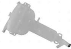
Deposito agua Volvo NL10 NL12

Código 2006138 | 3979992 | 21 | 3979992 1605862 000018 5937 5937 26138