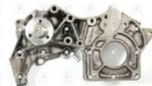
Bomba de agua Iveco Eurocargo 160E21 E23

Código 2007172 | 98415831 | 1 | 98415831 1560 11903 27172