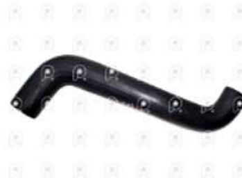
Manguera superior de radiador Ford 1722 6CT

Código 2007294 | XC458260DA | 3 | XC458260DA TJG121115B 3621 5540 27294