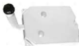
Deposito agua MB 1933 - 1618 - 1935

Código 2006125 | 3508607160 | 4 | 3508607060 000027 26125