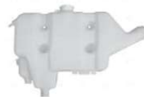
Deposito agua Agrale - Volare - VW

Código 2006068 | TAP121405 | 28 | TAP121405 2VC121405 000004 3598 6008001789004 3598 26068