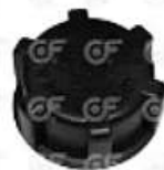
Tapa deposito de expansion Scania S4

Código 2003716 | 1849428 | 5 | 1374050 1849428 1757490 1989 7315 23716