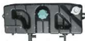
Deposito agua MB c/sensor 1218 - 1418 - 1718

Código 2006116 | 6935007049 | 4 | 6745000049 000128 6452 26116