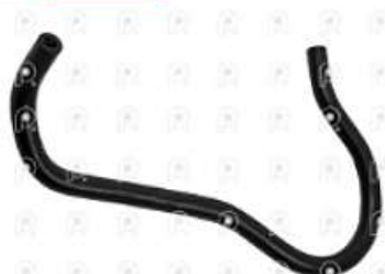
Manguera de refrigeracion Scania PGR

Código 2007052 | 1446227 | 5 | 1446227 2106 27052