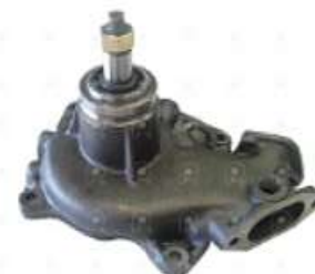
Bomba de agua Fiat 619 eje con rosca

Código 2006536 | 4606023 4952496 | 1 | 4606023 4952496 1806 26536