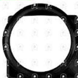
Deflector de ventilador MB 1620

Código 2008014 | 6955057030 | 4 | 6955057030 000279 28014