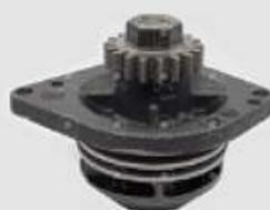
Bomba agua Ford VW Agrale MWM 4.12 6.12 TCE

Código 2006527 | 2R0121004A | 394028 | 2R0121004A 2R0121004F BA506 1592 601310113007 961087310036 961007310014 961207310016 961287310036 10267 26527