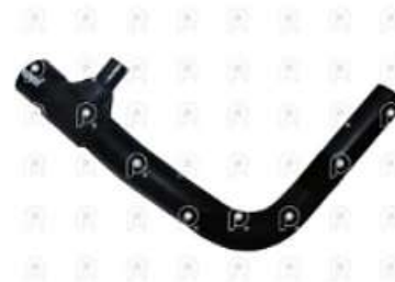
Manguera inferior de radiador Ford 815E

Código 2007287 | AC458286AC | 3 | AC458286AC 11211 27287