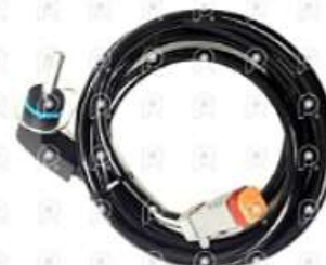
Sensor de temperatura Scania S4 S5

Código 2007570 | 1377930 | 5 | 1377930 1865317 27570