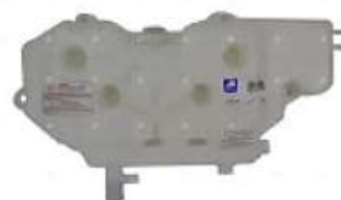
Deposito agua Ford Cargo 1722e 1832e S/tapa

Código 2003727 | 6C458A084AD | 3 | 6C458A084AD 000449 4222 23727