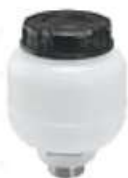
Deposito direccion hidraulica SC 112/113 MB

Código 2006082 | 538770 | 5 | 538770 0084310002 6854 000216 6854 26082