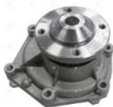
Bomba de agua Scania P94

Código 2006516 | 1380897 | 5 | 1380897 1394 11954 26516