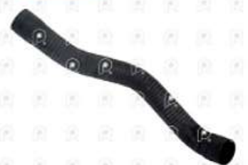
Manguera inferior de radiador Scania 113

Código 2007019 | 318350 | 5 | 318350 2610 27019