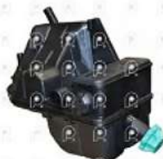
Deposito de expansion MB Actros OM501

Código 2006763 | 0005003049 | 4 | 0005003049 000738 26763