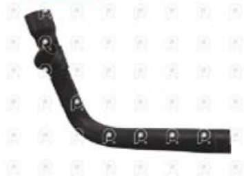
Manguera inferior de radiador Ford 915

Código 2007298 | 2C458286AA | 3 | 2C458286AA 5970 27298