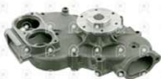
Bomba de agua MB OM457 Euro III

Código 2007621 | 4572000201 | 4 | 4572000201 1776 27621