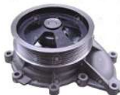
Bomba de agua Scania S4 S/tapa

Código 2006514 | 1508533 | 5 | 1508533 1353072 BA512 2444 1395 2444 26514