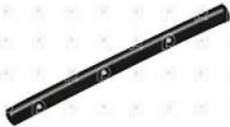
Manguera radiador agua Iveco Cursor Cavallino

Código 2007226 | 7147658 | 1 | 7147658 1560 27226