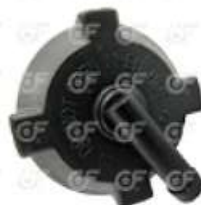
Tapa deposito de agua Iveco Cavllino Attack

Código 2004273 | 99489567 | 1 | 99489567 8584 24273