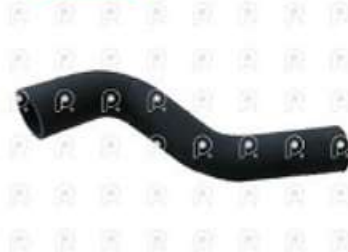
Manguera de refrigeración MB 1620

Código 2007262 | 3845017082 | 4 | 3845017082 2322 27262