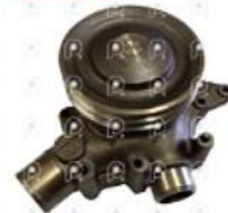
Bomba de agua Renault Midlum Premium

Código 2006645 | 5010450892 | 24 | 5010450892 5010553652 5600409620 1822 26645