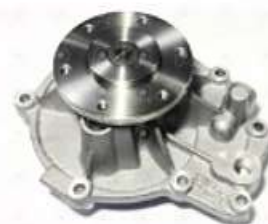
Bomba de agua VW 17280

Código 2006525 | BA1970 | 28 | BA1970 26525