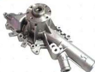
Bomba de agua MB Sprinter OM611

Código 2006507 | 6112000801 | 4 | 6112000801 6112001101 6112000501 6112001601 1763 8722 26507