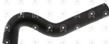
Manguera refrigeracion Scania S4 PGR

Código 2006653 | 1496815 | 5 | 1496815 2854 11312 26653