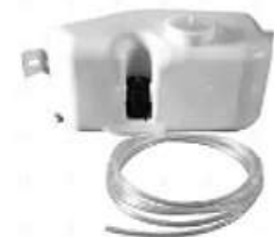
Deposito limpiaparabrisas MB c/bomba 12V 1620

Código 2006228 | 6948607060 | 4 | 6948607060 000648 26228