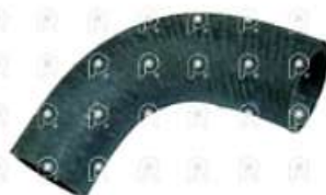
Manguera de refrigeración Scania 113

Código 2007013 | 290864 | 5 | 290864 2621 7916 27013