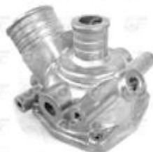
Caja Porta Termostato Scania 112/113

Código 2003145 | 372132 | 5 | 372132 2431 23145