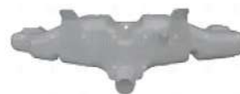
Deposito limpiaparabrisas Ford NOVO

Código 2006049 | BC4517618AA | BC4517618AA 000033 6502 6502 26049