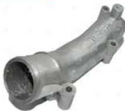
Brida sistema de refrigeracion Scania S4

Código 2005934 | 1400145 | 5 | 1400145 25934