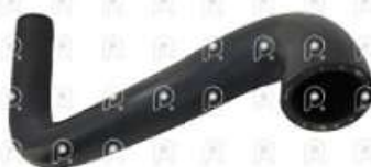
Manguera inferior de radiador Iveco Tector

Código 2007058 | 503348181 | 1 | 503348181 1514 27058