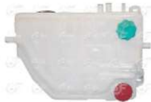
Deposito agua MB Atego

Código 2003722 | 9705000349 | 4 | 9705000349 9705000449 000899 23722