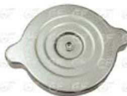
Tapa radiador 14 libras MB LO914/915

Código 2005130 | 1245000206 | 4 | 10352 1245000206 1245000406 2228 25130