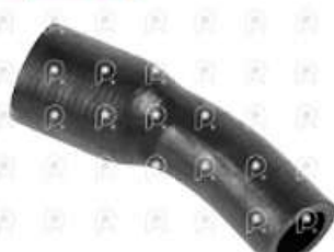
Manguera carcaza de termostato Scania 113

Código 2007040 | 382985 | 5 | 382985 2627 27040