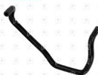
Manguera de fregirecion Scania PGR

Código 2007049 | 1886819 | 5 | 1886819 2104 27049