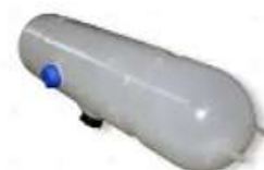
Deposito agua MB O500 c/sensor

Código 2006123 | 6345000049 | 4 | 6345000049 6345400017 6851 000140 26123