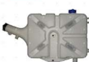
Deposito agua VW c/tapas

Código 2006051 | 250121405C | 28 | 000153 3185 250121405C 3185 26051