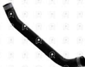
Manguera inferior de radiador Iveco Tector

Código 2007074 | 500362700 | 1 | 500362700 1570 27074