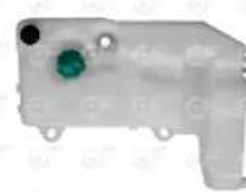
Deposito expansion Iveco nuevo Stralis Trak

Código 2003712 | 41215631 | 1 | 41215631 6472 000481 23712