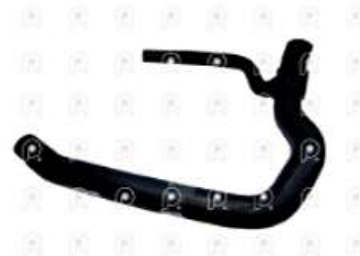
Manguera inferior radiador Ford 1722 L/nueva

Código 2007284 | AC458286CA | 3 | AC458286CA 11208 27284