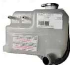
Deposito agua MB Bus LO 914/915

Código 2006121 | 6675000349 | 4 | 6675000349 000157 6454 26121