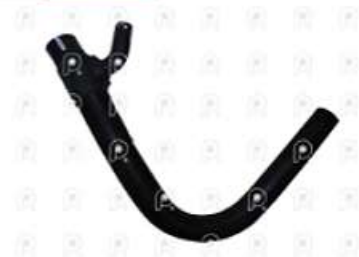
Manguera inferior de radiador Ford 1517E

Código 2007288 | 4C458286BE | 3 | 4C458286BE 11223 27288