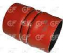
Manguera intercooler Scania 112/113

Código 2004392 | 488368 | 5 | 488368 4589 525050 390581 1522011 1010 4589 24392