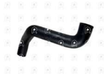
Manguera superior radiador Ford 1932

Código 2007285 | AC458260DA | 3 | AC458260DA 11209 27285