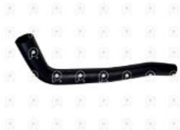
Manguera inferior de radiador Ford 1722

Código 2007291 | TRA121073A | 3 | TRA121073A TAV121073A XC458286VA 11380 27291