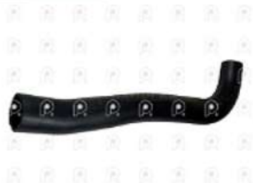
Manguera de agua Ford 1722 1730 6CT

Código 2007295 | XC458286TA | 3 | XC458286TA 3622 2RT121073 8438 27295