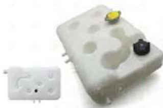
Deposito agua c/sensor MB 1218 1418 1623

Código 2006177 | 3845008449 | 4 | 3845008449 5933 000013 5933 26177