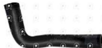
Manguera salida de calefaccion Iveco Tector

Código 2007078 | 504248697 | 1 | 504248697 1626 27078