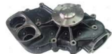
Bomba de agua MB OM 447 449 1633 1634

Código 2006499 | 4032004901 | 4 | 4032004901 4752000201 4752000101 1281 RD314 10173 26499