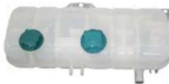
Deposito agua Volvo NH12 380 - 420 - 460 C/Ta

Código 2006139 | 1674916 | 21 | 1674916 000231 4017 4017 26139