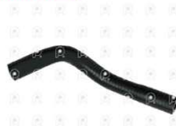
Manguera de refrigeracion MB Sprinter OM651

Código 2007270 | 9065010782 | 4 | 9065010782 2877 27270