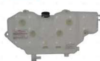
Deposito agua Ford elect. c/tapas

Código 2006060 | 6C458A084AD | 3 | 6C458A084AD 000904 6C458A084AB 6C458A084AC 4222 26060