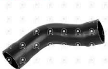
Manguera radiador de agua Scania 113

Código 2007039 | 1340201 | 5 | 1340201 534421 2619 8981 27039