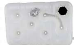
Deposito agua MB c/sensor 1218 - 1418 - 1620

Código 2006113 | 3845008949 | 4 | 3845008949 5935 000015 5935 26113