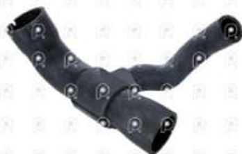
Manguera de termosta a tubo rígido Scania S4

Código 2007012 | 1373919 | 5 | 1373919 2595 27012