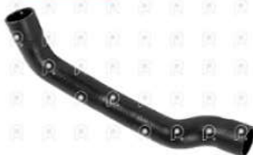
Manguera de refrigeracion Scania PGR

Código 2007057 | 1755951 | 5 | 1755951 2581 1446229 27057