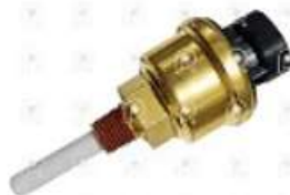
Sensor Nivel de agua Ford Cargo 1722E

Código 2006669 | 6C458B397BA | 283 | 6C458B397BA 2R0941038A 001038 26669