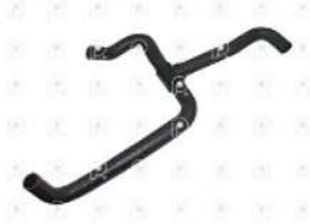
Manguera de radiador MB 1620

Código 2007256 | 6955017382 | 4 | 6955017382 2357 27256