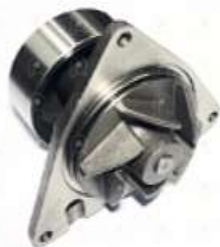
Bomba de agua Ford VW cummins ISC 8.3L

Código 2006529 | 283 | BG6X8501AA BG7X8501AA 1709 BA631 10168 26529