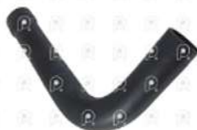
Manguera radiador agua Iveco Cavallino

Código 2007220 | 503346827 | 1 | 503346827 1579 27220