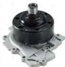
Bomba de agua MB Sprinter OM651

Código 2006509 | 4 | 6512002301 1910 26509