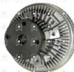
Embrague viscoso MB 712 914 1418

Código 2007695 | 9042000622 | 4 | 9042000622 9042000323 3662005523 5782 27695