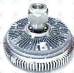
Embrague viscoso Volvo VM

Código 2007696 | 20765694 | 21 | 20765694 27696