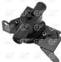
Valvula comando calefaccion Scania S4 - OR

Código 2004666 | 1795464 | 5 | 1795464 11000 24666