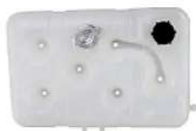
Deposito agua MB c/sensor 1218 - 1418 - 1620

Código 2006113 | 3845008949 | 4 | 3845008949 5935 000015 5935 26113