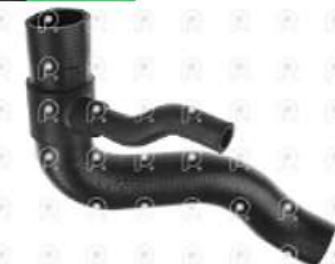
Manguera inferior Radiador MB Sprinter OM611

Código 2007266 | 9015012682 | 9015012682 2458 27266