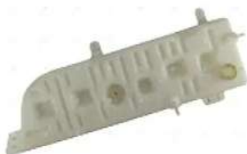
Deposito agua FORD 14000 99/05

Código 2006044 | F81Z8A080 | 3 | F81Z8A080AA 5945 000154 26044