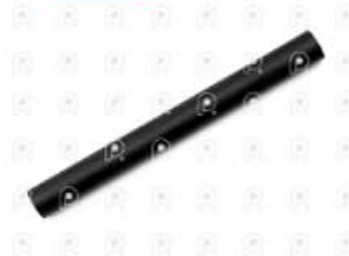
Manguera salida dep de agua VW 17250

Código 2007303 | 2RL121110 | 28 | 2RL121110 3685 27303