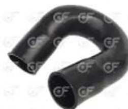
Manguera de agua Scania S4 - OR

Código 2004498 | 1511620 | 5 | 1511620 1494718 24498