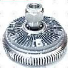
Embrague viscoso Volvo VM