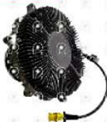
Embrague viscoso VW 17280

Código 27699 | 2U2121302A | 28 | 2U2121302A